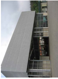
Fachada lateral noroeste.