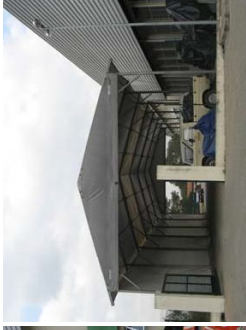
Espaço para estacionamento nos fundos do edifício.