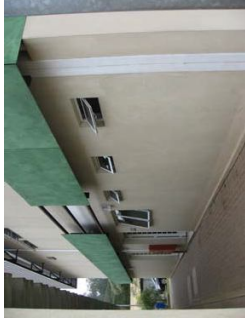
Fachada lateral com acesso ao ambulatório. Fachada principal.