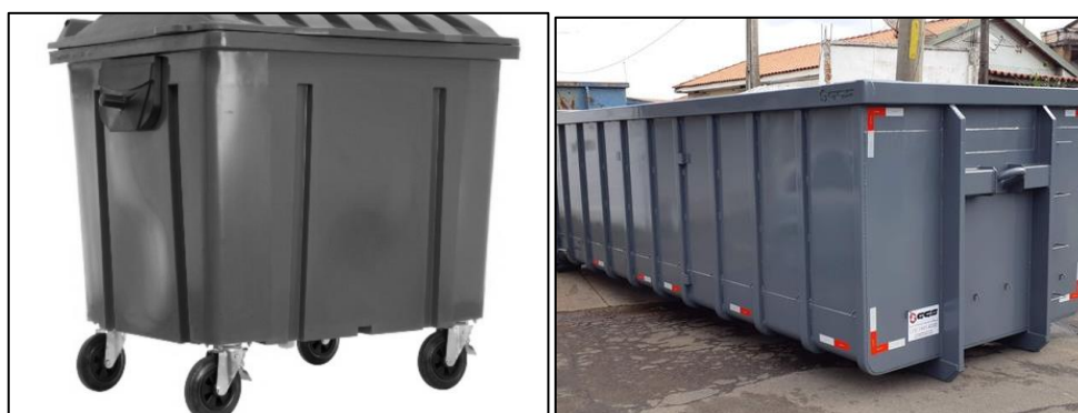
Figura 4: Container de 1000 L (direita) e caçamba de 26 m³ (direita).