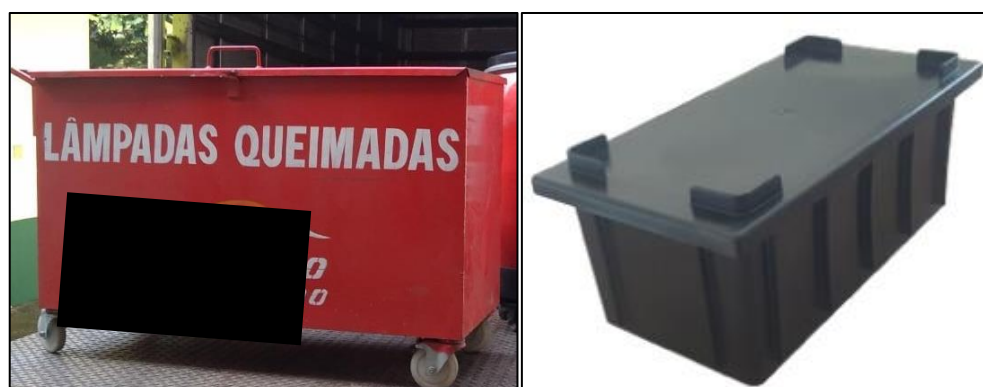
Figura 2: Container metálico para lâmpadas (esquerda) e caixa plástica de 4,2 L (direita).