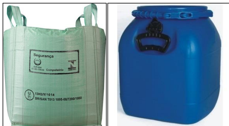
Figura 1: Big bag homologado (esquerda) e bombona homologada 20 L (direita).

As Figuras de 1 a 5 exemplificam as formas de acondicionamento detalhadas anteriormente. As dimensões e materiais de composição não poderão ser alterados, visto que foram escolhidos por facilitarem a organização no local e promoverem melhor ergonomia aos colaboradores internos.