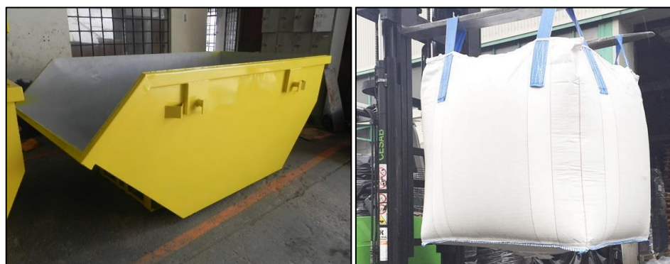
Figura 5: Caçamba de 7m³ (esquerda) e big bag comum (direita).

No momento da coleta de lâmpadas, eletroeletrônicos, pilhas e baterias, a CONTRATADA deve repor cada embalagem transportada no momento da retirada, semelhante as trocas de caçamba, no qual uma é retirada e outra de mesma capacidade é deixada no local.