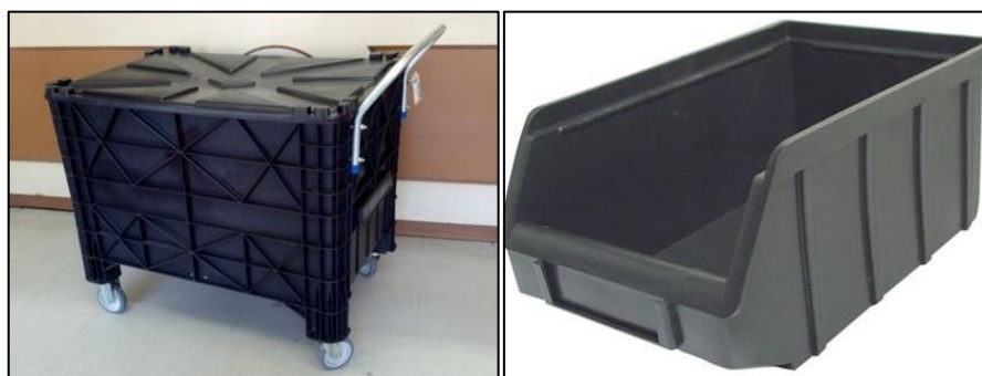
Figura 3: Caixa plástica de 370 L com rodas (esquerda) e outra de 4,2 L para pilhas (direita).