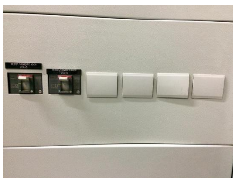
Foto 1 - Espaço disponível para instalação do novo disjuntor - Vista Externa.